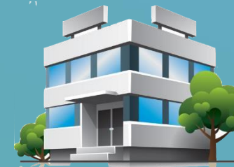
Instelling C Cat. klein