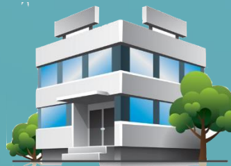
Instelling A Cat. groot